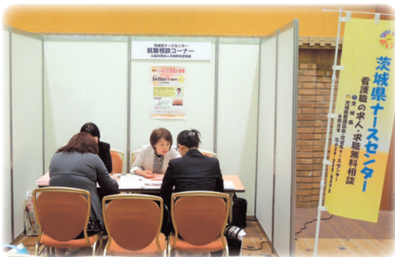
出張ナースバンク (H24. 4.28 茨城県看護職就職ガイダンスにて)