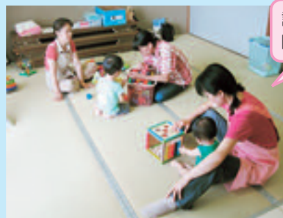
託児室 開設します