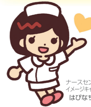
ナースセンター イメージキャラクター はぴなちゃん

看護の仕事に復帰したいがブランクがあり、 不安がある。一歩が踏み出せない。 復職したが技術に不安がある。 あなたを応援します！