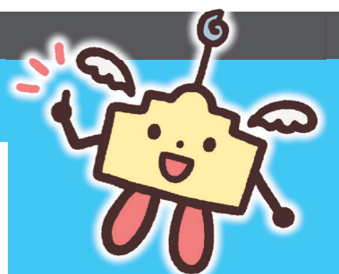
ナースセンターくん