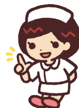
茨城県ナースセンター キャラクター はびなちゃん