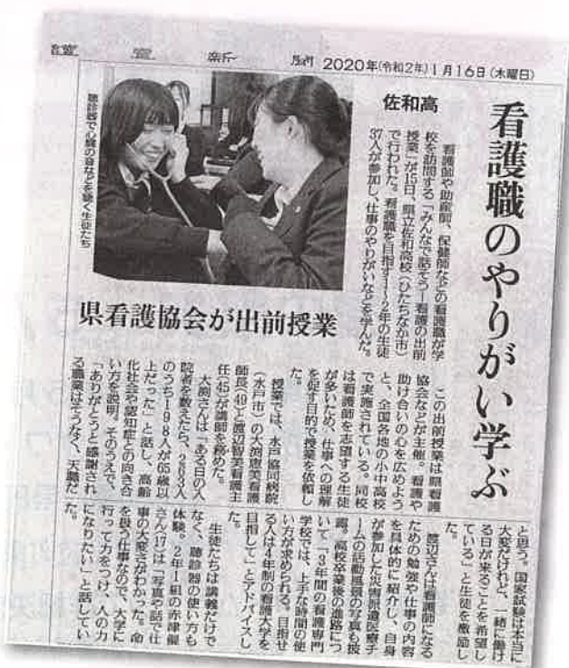
2020年1月16日 読売新聞記事

生徒から「看護師は患者と命を共有できる仕事であることが理解できた。看護師になるために努力したい。」というお礼の言葉があり、多くのことを感じ取ってもらえたと思いました。