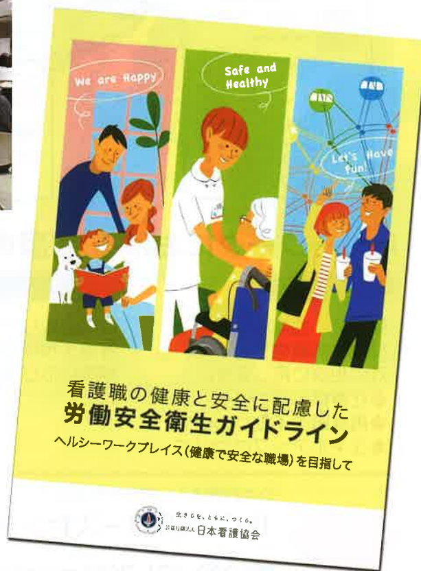
ガイドライン表紙

https://www.nurse.or.jp/nursing/shuroanzen/safety/