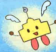
ナース センターくん