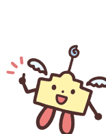
ナースセンターくん